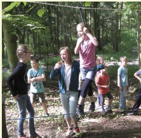
Kinder bei einer Ferienaktion mit dem mobilen Niedrigseilgarten im Wald, gemeinsam aktiv, Geben und Nehmen ist gefordert

Das Kinderhaus (Kindertagesstätte) mit Krippe, Kindergarten und Hort ermöglicht Leben, Lernen und Spielen in altersgemischten Gruppen. Individuelle und vielfältige Lernerfahrungen passieren in alltäglichen Sinnzusammenhängen, die Räumlichkeiten und das Außengelände bieten die Gelegenheiten dazu. Besonderen Stellenwert hat die generationsübergreifende Kultur im Haus, die Gelegenheit gibt, auch alte Menschen kennen zu lernen.