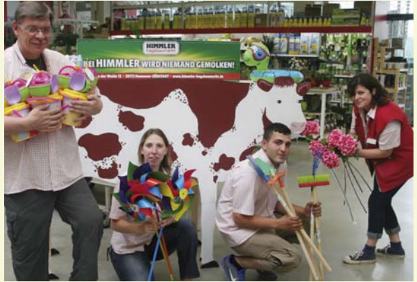
Himmler Hagebaumarkt, An der Weide 12, www.hagebaumarkt-himmler.de

Von 12 bis 17 Uhr sind ganz besonders alle Kinder herzlich eingeladen gemeinsam mit ihren Eltern, Großeltern und Freunden in das Geschäft zu kommen. Überall in den großzügigen Gängen des Marktes und draußen wird es kreative und lustige Aktionen für die Kids geben. Sie dürfen die berühmte Nadel im Heuhaufen suchen, T-Shirts bunt bemalen, sich schminken lassen, Ballontiere zaubern und einen Kratzbaum von der Firma Fressnapf bauen. Auf der Hüpfburg hüpfen man bis in den Himmel, es heißt „Wasser marsch“ und die Kids können ihr Geschick beim Kühe melken probieren.