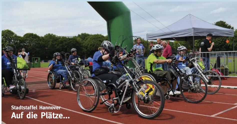
Stadtstaffel Hannover Auf die Plätze...

Sportbegeisterte freuen sich auch in diesem Jahr auf die Stadtstaffel Hannover mit einem attraktiven, abwechslungsreichen Rahmenprogramm und spannenden Staffelwettkämpfen. Jeder kann mitmachen! Der Inklusionsgedanke wird bei der Stadtstaffel groß geschrieben: Neben den langjährig bekannten Wettbewerben geht das traditionelle Rennen der Handbiker erneut als Staffelwettbewerb an den Start. Darüber hinaus können auch Menschen mit körperlichem oder geistigem Handicap zusammen mit Begleitenden oder Betreuenden aktiv dabei sein.